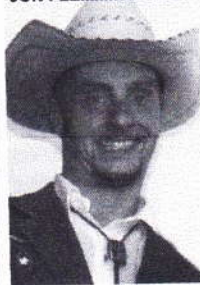
JON FLEMMING OLSEN